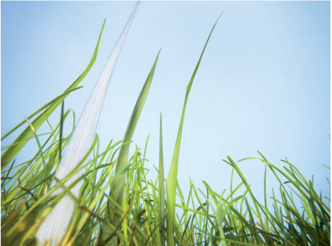
PURAVIS™: die neuen Glasfasern mit besonders langer Lebensdauer

In PURAVIS™ steckt viel Zukunft. Und zwar auf doppelte Weise: Die Fasern verfügen über eine höhere Lebensdauer und sie geben Impulse für eine Vielzahl innovativer Einsatzmöglichkeiten.